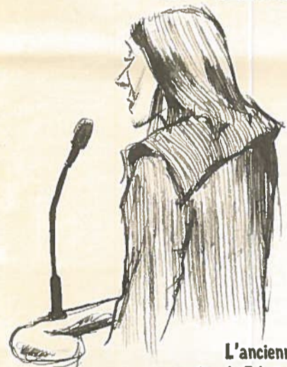
L'ancienne copine de Fabrice, un fils d'Emile Louis :